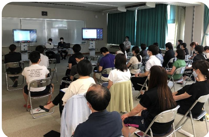
研修を受ける様子（視聴覚室 小学部）