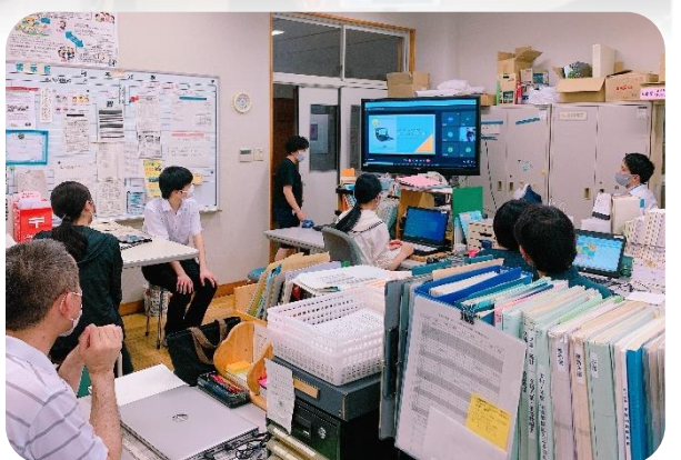
パソコン等を用いて研修に参加する様子 （南1階職員室 高等部職員）