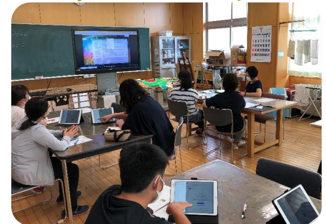
実際に iPad を使ってアプリケーションを使う様子 （美術室 中学部職員）