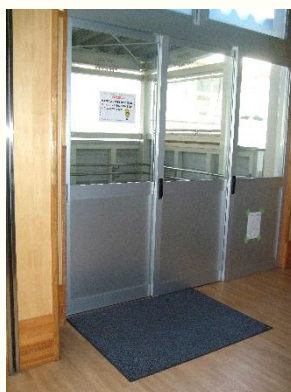
フロアマットリース