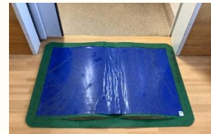
調理ワゴン用粘着シート