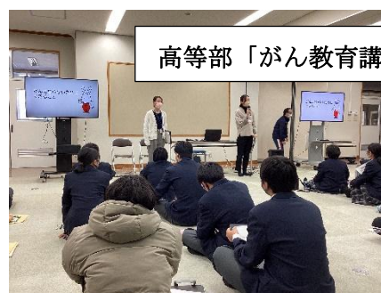
高等部「がん教育講話」

全学部で95%を超える結果となりました。「性に関する指導」については、担任と養護教諭が連携しながら指導を行っています。児童生徒の実態に合わせ「男女の体の違い」や「人との距離」などの授業を実施しており、必要に応じて、養護教諭が指導の相談を受けたり、教材の貸出等を行ったりしています。また、「歯磨き指導」や「がん教育」等についても講師を呼び、講話や実技指導等をいただきながら取り組んでいます。今後も家庭等と連携を図りながら取り組んでいきたいと考えます。