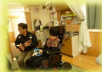
社会福祉法人つばさ福祉会 新おおぞらの夢様

実習を受け入れてくださった事業所の皆様、また、校内実習の材料を提供してくださった事業所の皆様、御協力ありがとうございました。