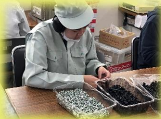
社会福祉法人しのぶ福祉会 あづま授産所様