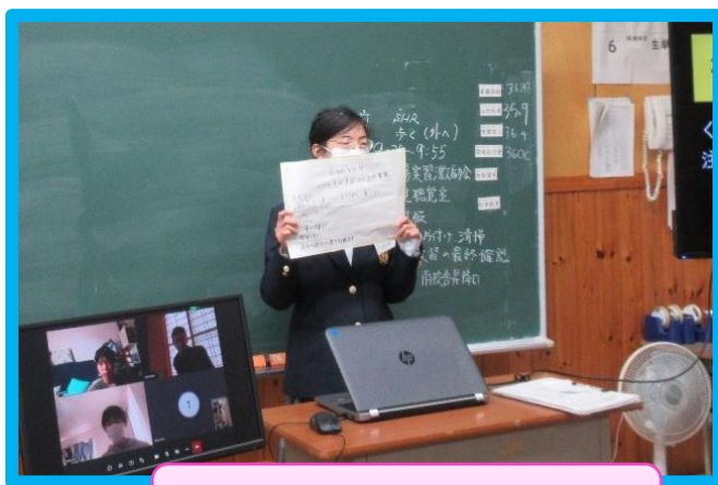
自宅からリモートでの参加