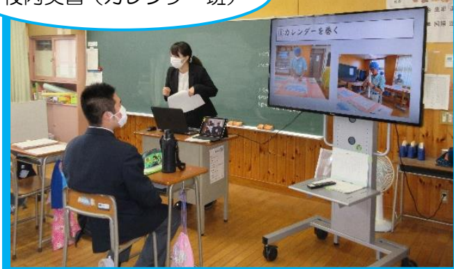
校内実習（カレンダー班）

後期実習は令和4年11月7日(月)から11月18日(金)までの10日間で行われます。校外実習では、福島市内を中心に、36の企業と事業所に生徒を受け入れていただきました。