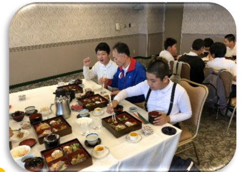
ホテルランチ@リステル猪苗代