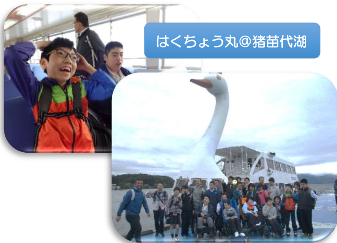
はくちょう丸@猪苗代湖