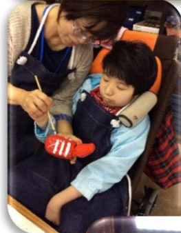
赤ペコ絵付け体験 @会津民俗館