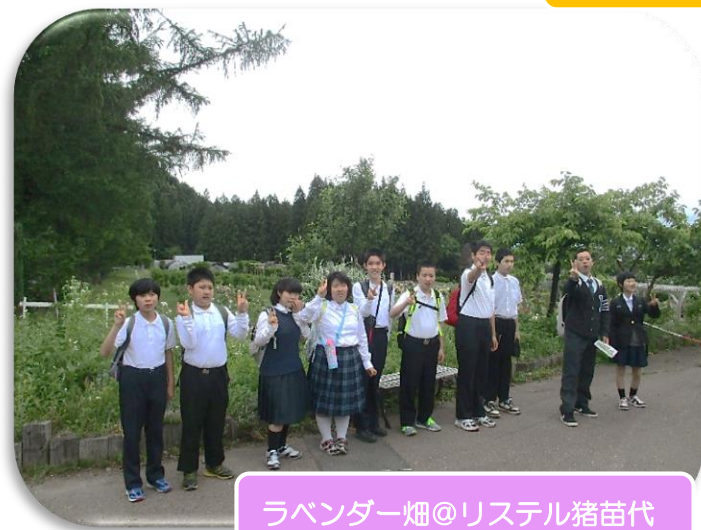
ラベンダー畑@リステル猪苗代